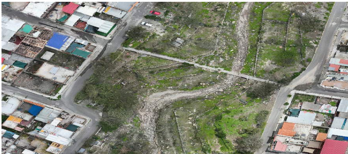
FIGURA N°02: TRAMO CRÍTICO SE OBSERVA QUE REQUIERE LIMPIEZA Y DESCOLMATACION LA QUEBRADA S/N