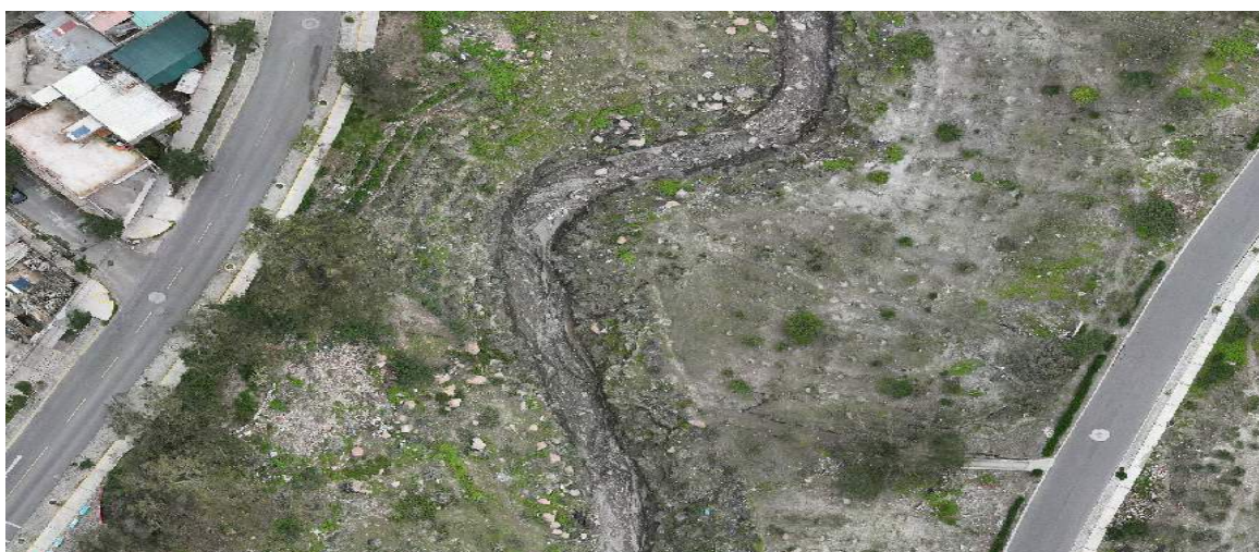
FIGURA N°04: SE OBSERVA Poca VEGETACION POR LO QUE LAS AUTORIDADES LOCALES DEBEN ELABORAR Y EJECUTAR PROYECTOS DE FORESTACION