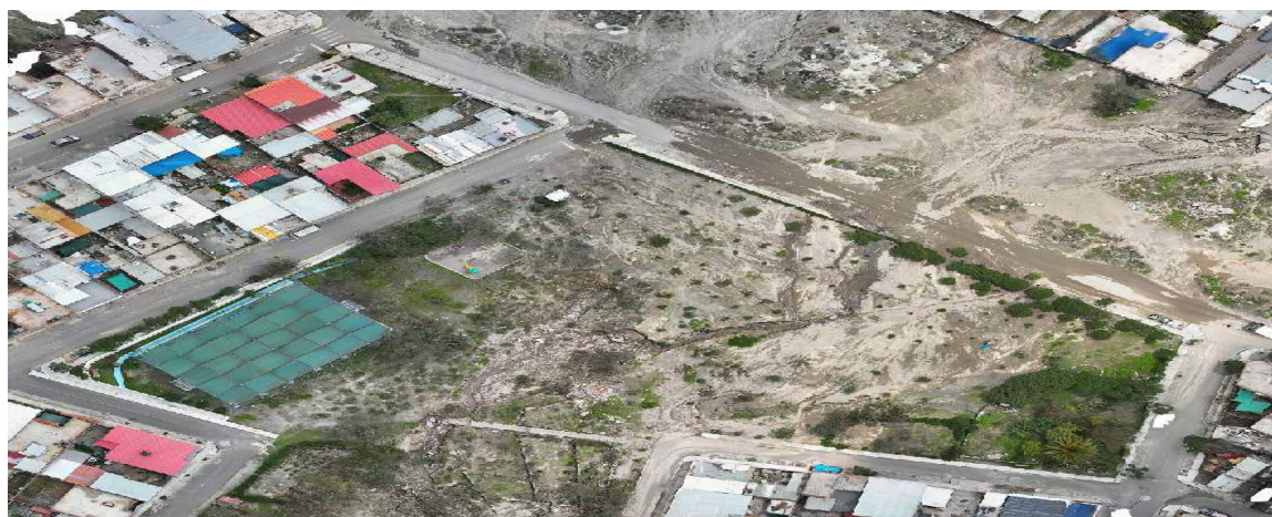
FIGURA N°01: TRAMO CRÍTICO EN LA QUEBRADA S/N, EL INICIO DE LA QUEBRADA INUNDANDO LA CARRETERA ASFALTADA PARA DESCOLMATACION