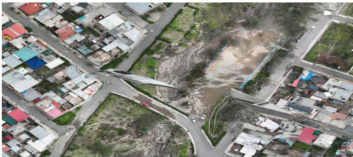
FIGURA N°03: TRAMO CRÍTICO COLMATADO POR MAXIMA AVENIDA INUNDANDO LOSA DEPORTIVA QUE SE ENCUENTRA CONSTRUIDA DENTRO DE LA FAJA MARGINAL